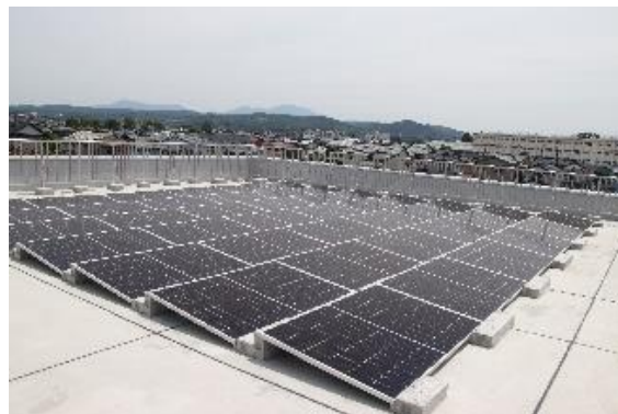
<太陽光発電システム>