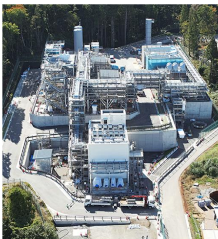
長岡メタネーション実証

また、長岡市と北陸ガスは、2026年3月6日に包括連携協定を締結しており、本取り組みは本協定における脱炭素社会の実現に関する取り組みの一環として実施したものととなります。