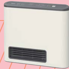
ガスファンヒーター

ガスファンヒーターはパワフルなのに消費電力はわずか20W。 電気エアコンの暖房運転に比べ、大幅な節電ができます。