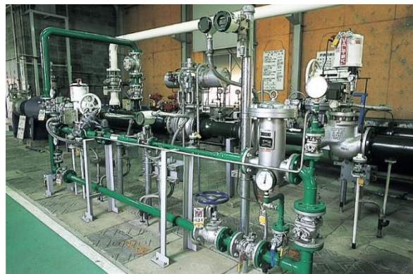
認定を受けた消化ガス製造設備