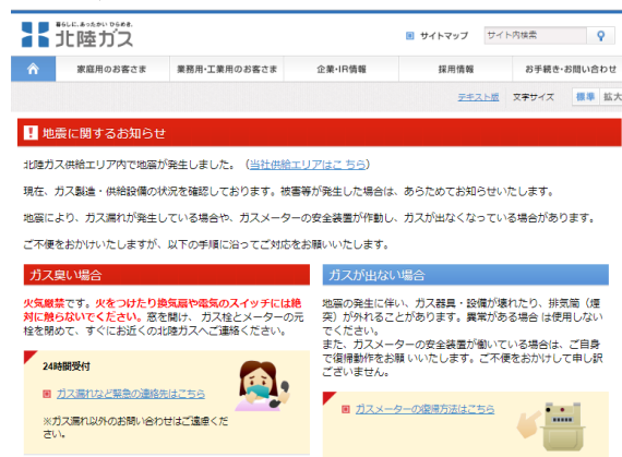
災害時用ホームページ

大規模な災害が発生した場合に必要な情報発信を行うための災害時用ホームページを平常時から準備しています。大規模災害が発生し、二次災害防止のためにやむを得ず、供給停止した場合における供給停止地区の地図表示、復旧作業の進捗状況等の情報発信を行えるようにしました。また、ガスの使用再開にはお客さまの立ち会いが必要になりますが、お客さまが不在の場合でも再度訪問する受付をホームページ上で行えるようになりました。